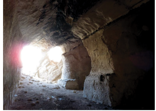
תמונה 4: "המאגורה הגדולה" - מאגורה קדומה לאיסוף מי שטפונות, הגדולה ביותר בצפון מדבר יהודה, לפני השוד וההרס המסיבי (מימין) ולאחריו (משמאל).