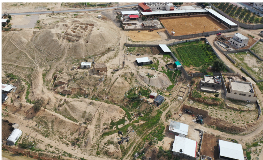
תמונה 1: "הארמון השלישי" של הורדוס ביריחו (שטח א): שדוד, הרוס ומוזנח, מוקף במבנים חדשים שהוקמו על שרידי "הגנים השקועים" - פלא ארכיאולוגי ברמה בינלאומית שאבד לנצח.

365 האתרים שנדגמו בסקר חולקו לארבע קבוצות לפי דרגת החשיבות למורשת הלאומית ולמחקר המדעי: 24 אתרים בקבוצה א', 52 אתרים בקבוצה ב', 49 אתרים בקבוצה ג' ו-240 אתרים בקבוצה ד'. בקבוצה א', הכוללת את האתרים החשובים ביותר, נמצאים אתרים שהגישה אליהם הייתה אפשרית, באופן פיזי או מן האוויר, ולפיכך ניתן היה לבחון בצורה מיטבית את הנזק שנגרם להם. בקבוצה ב' נכללו אתרים ברמת חשיבות מדעית דומה, אך כאלו שהגישה אליהם לא התאפשרה מסיבות ביטחוניות. המידע שנאסף לגבי אתרים אלה כלל מסקנות של דו"חות חפירה מרכזיים, ולעיתים אף סימון ויזואלי של הממצאים על גבי תצלום אוויר של האתר.