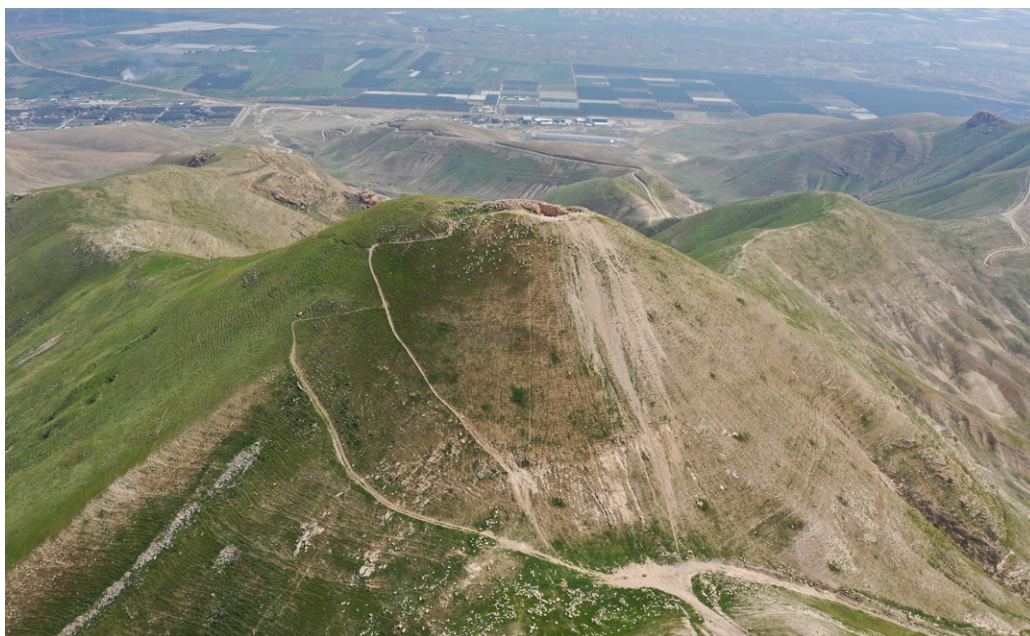
תמונה 3: קרן סרטבה, שפכי שוד טריים מעל מערכת המים המזרחית, מרץ 2020.