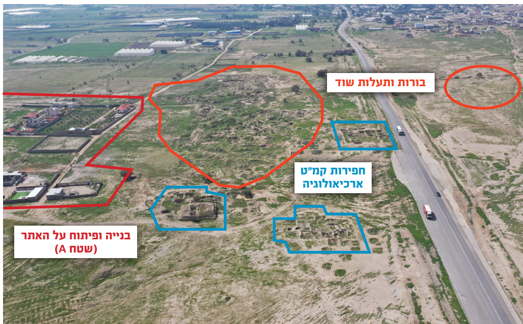
תמונה 2: ארכלאיס: מגה-מטרופולין חשמונאית-הרודיאנית בבקעת הירדן, צמוד לכביש הבקעה, הסובלת משוד והרס בהיקף עצום, מרץ 2020.