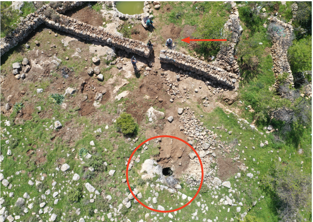
תמונה 5: חוליית שודדים בפעולה בתל עיטם המקראי, ליד בור השוד שחפרו (מוקף בעיגול) בתקופת הקורונה, מרץ 2020.