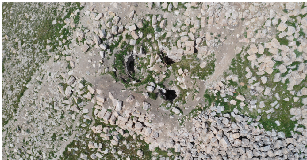
תמונה 9: קרן סרטבה, בורות השוד העתיקים בראש המבצר, שנחפרו בראשית המאה ה־20, ומסביבם שפכי עפר טריים. מרץ 2020.