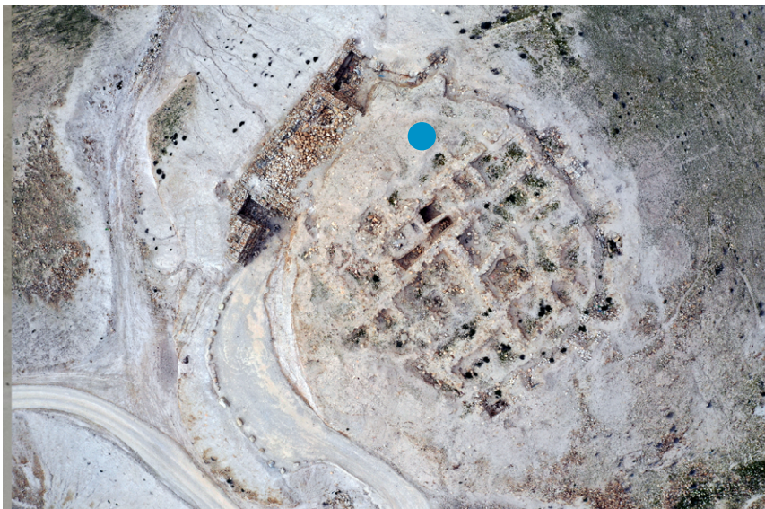
תמונה 12: מבצר קיפרוס, מסומן כנקודה בלבד (בכחול) במאגרי המידע של המנהל, ללא הגדרת גבולות האתר כנדרש.