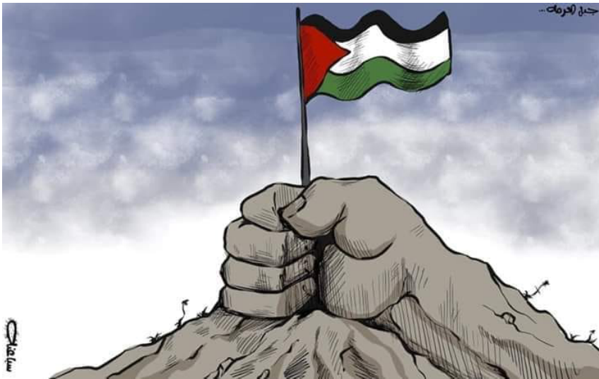
תמונה 11: תל ארומה. קריקטורה פלסטינית שפורסמה בפייסבוק, ובצידה הכיתוב: ג'בל אל-עורמה - מעוז לאומי פלסטיני וסמל לאחיה האיתנה.