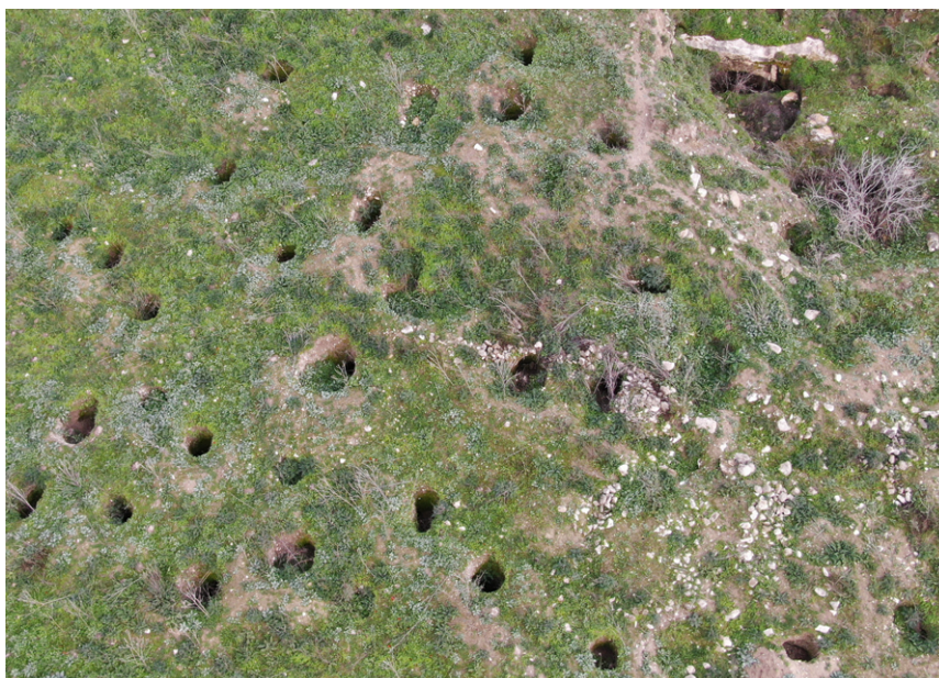
תמונה 6: בורות שוד, חלקם בעומק של 6-7 מטרים ומתוכם מציצות צמרות עצים שצמחו בהם, במדרון המערבי של תל דותן.

לאחרונה מבצעת הרשות הפלסטינית שינויים מואצים ומוכווני-מדיניות גם בתחום החקלאי. 18 במסגרת התוכנית הפלסטינית להשתלטות על שטחי C, שטחים נרחבים ביהודה ושומרון זוכים לפיתוח קרקע אינטנסיבי בהיקף עצום - והללו אינם פוסחים, כמובן, על אתרים ארכיאולוגיים. הפיתוח נעשה בצורה מסיבית מאוד והרסנית כלפי האתרים, בצורה שלא הייתה בעבר.