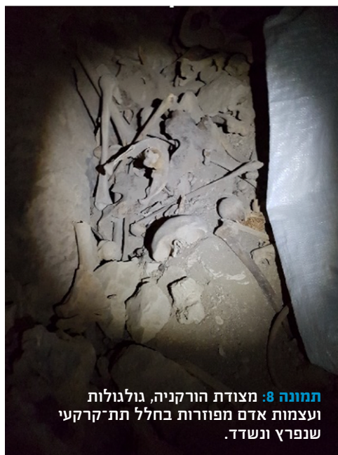
תמונה 8: מצודת הורקניה, גולגולות ועצמות אדם מפוזרות בחלל תת-קרקעי שנפרץ ונשדד.